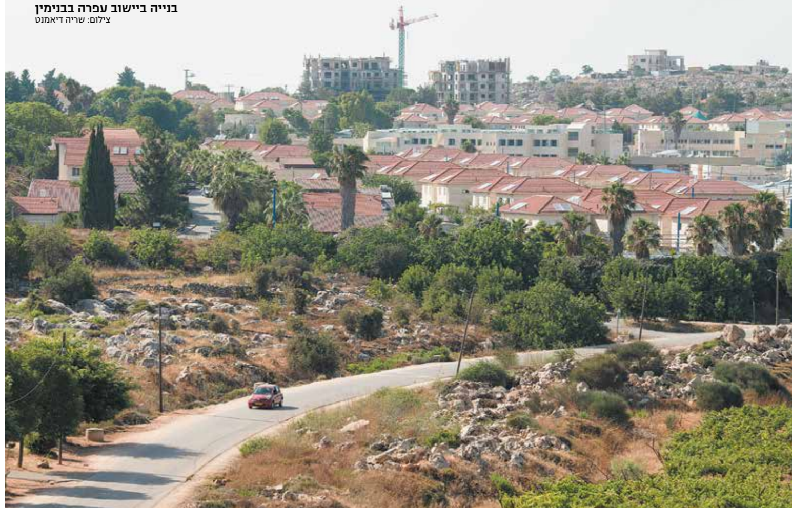
בנייה ביישוב עפרה בבנימין

אנו מקווים כי לאחר הבחירות תקום ממשלת ימין-חרדים שתבסס על שומרי המצוות ואוהבי המסורת היהודית במדינת ישראל, וממילא תתאפשר גם החלת ריבונות מלאה בשטחי יהודה ושומרון, צעד שיש לנקוט באחריות ובהירות בהתחשב בהשלכות הדיפלומטיות והבינלאומיות הכרוכות בו. אנו