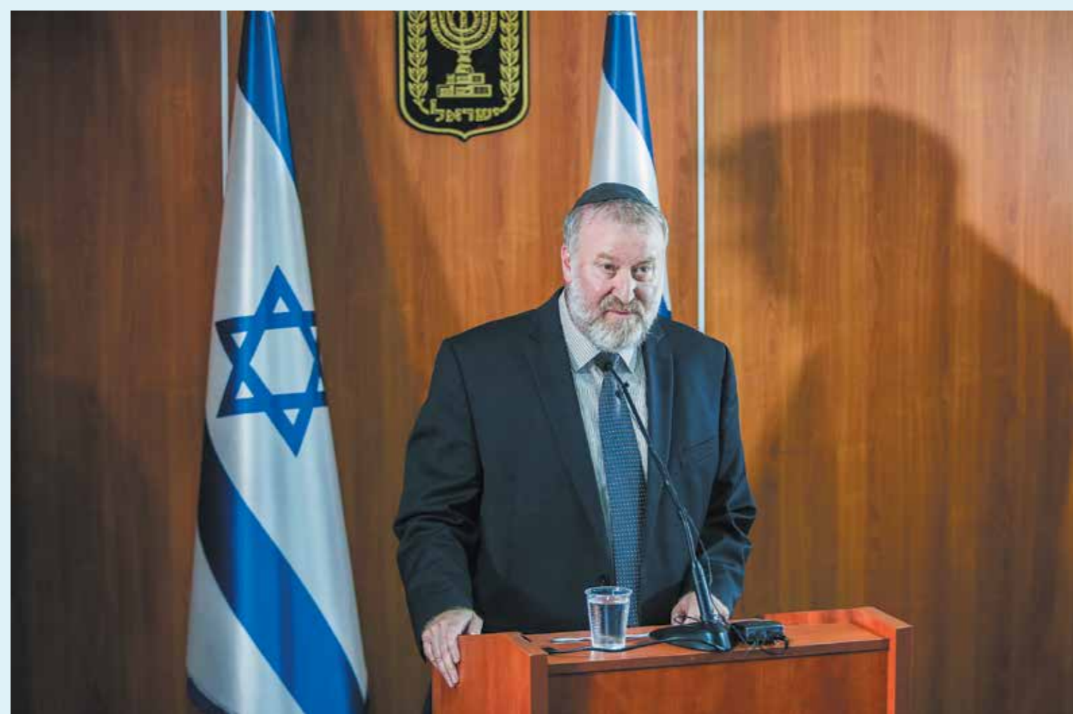
היועמ"ש מנדלבלט

הדוגמה האחרונה לפריכות חוות דעתו של היועמ"ש פורסמה מעל דפי עיתון זה, בנוגע להתנגדות היועץ המשפטי לממשלה אביחי מגדלבלט לנקיטת סנקציות כנגד סרבני חיסונים. לדבריו יש לחוקק חוק חדש לצורך העניין, אשר ייאלץ כמונן לעבור תחת ביקורת בג"ץ. אלא שכפי שנחשף, אותו יועץ עצמו