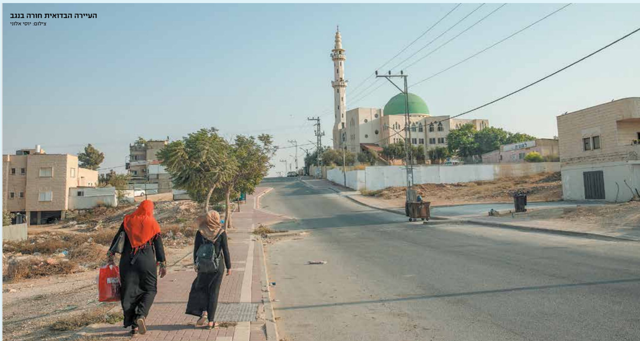
העיירה הבדואית חורה בנגב

הפזורה הבדואית הבלתי חוקית בנגב היא סוגיה לאומית כבדת משקל, שנדמה כי כל הניסיונות להסדרתה הביאו רק להחרפת הבעיות וליצירת כאוס וחוסר משילות. מה תשנו ותחדשו בטיפולכם בסוגיה זו?