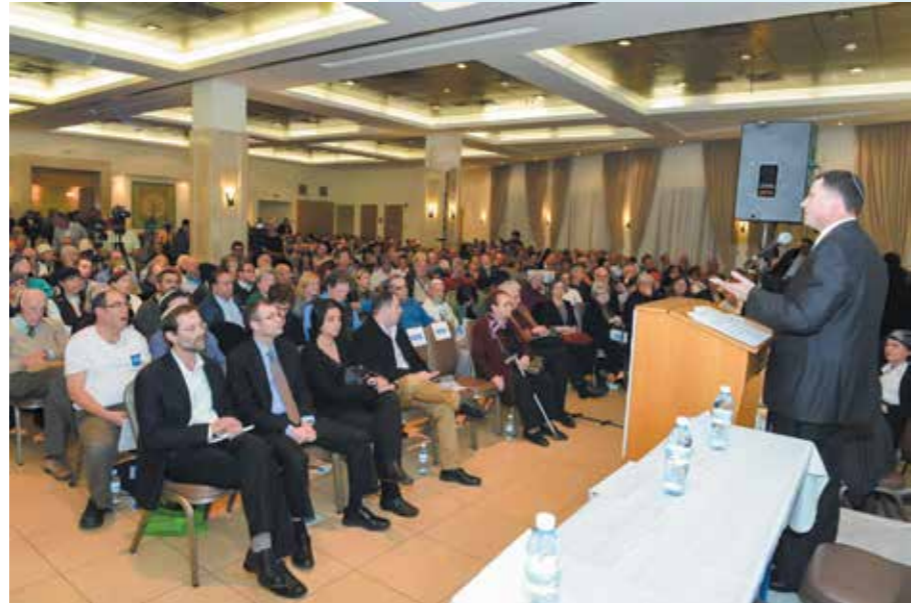
כנס ריבונות ה-3 בירושלים, ינואר 2013

סומכים בעניין זה על גישתו ומהלכיו של ראש הממשלה מר בנימין נתניהו.