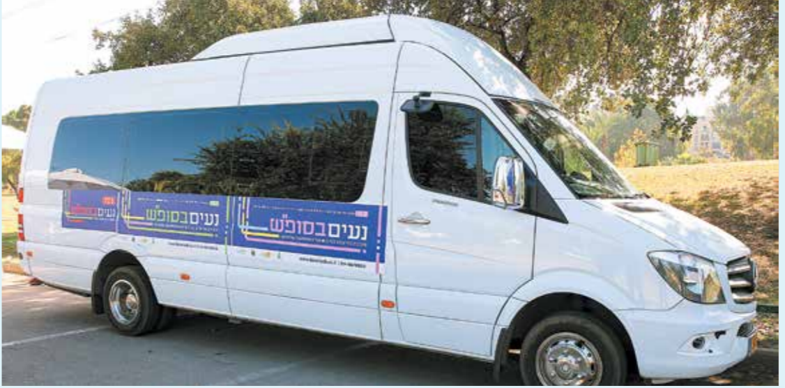
מיזם תחבורה ציבורית בשבת וההפגנות נגדו

ליפיד 2021 יש עתיד סוגיית השבת ומימוש הערכים הטמונים בה היא אחת הסוגיות החשובות המורכבות הקיימות במדינה היהודית ודמוקרטית. יש עתיד מאמינה כי יש לאפשר לכל אורח לממש את ערכי השבת בדרכו ועל פי אמונתו. על בסיס אמנת גביון מודן, יש עתיד מאמינה כי יש לשמור על ייחודה של השבת כיום המנוחה הממלכתית במדינת ישראל, ולצד זאת לאפשר פעילות תרבות ורוח ופעילות קהילתית אשר יש בה כדי לענות לצורכיהם של כלל אזרחי ישראל. נפעל כדי לאפשר תחבורה ציבורית בשבת