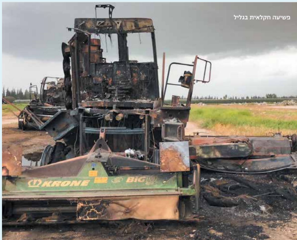
פשיעה חקלאית בגליל