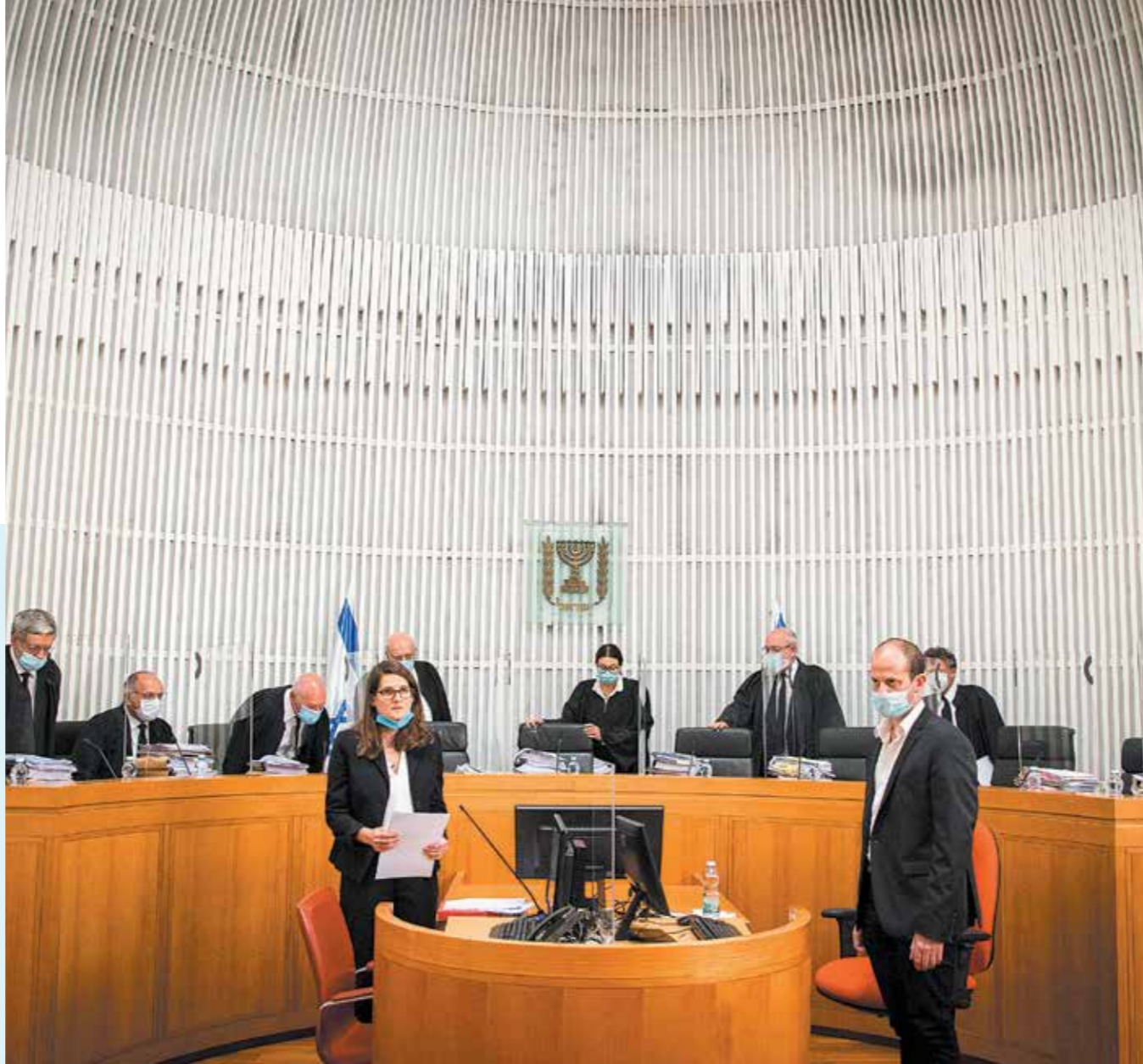
▲ בית המשפט העליון, מאי 2020

שיטת מינוי השופטים בישראל במתכונתה הנוכחית היא טובה