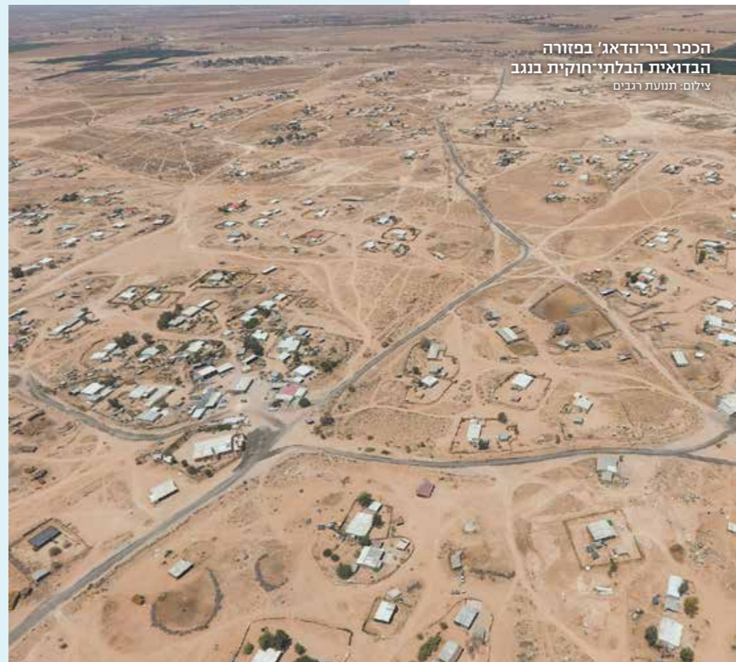
הכפר ביר'הדאג' במזורה הברואית הבלתי חוקית בנגב