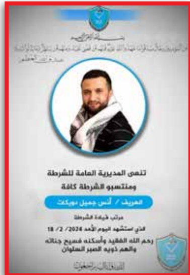
כרוז מטעם מנגנון המשטרה לכבוד אנס דויכאת