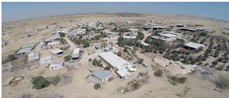
בתמונה: המקבץ הבלתי חוקי המכונה 'אום אל חיראן', בשנת 2015.

במהלך ינואר 2016, דחתה נשיאת בית המשפט העליון, מרים נאור, את הבקשה לקיום דיון נוסף בעתירה, ובכך חתמה סופית את הסאגה המשפטית. למרות פסק הדין הברור, המשיכו ארגוני השמאל בקמפיין הדה-לגיטימציה נגד הקמת היישוב, ורק בשלהי שנת 2024 פונה סופית השטח המיועד להקמתו. כדי להכיר את האמת הפשוטה לאשורה, נביא בעמודים הבאים את השתלשלות העובדות ההיסטוריות על רצף הזמן.