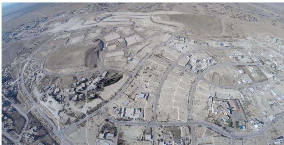
בתמונה: מגרשים מפותחים למגורים בעיירה חורה המיועדים לתושבי 'אום אל חירן'.

שנות ה-80 ואילך: רוב שבת אבו אלגיען עוזב את הפזורה ועובר למגורי הקבע בעיירה חורה הסמוכה. מיעוטם נשאר באזור ההתיישבות בעתיר ומעמיקים את אחיזתם באזורים הנוספים עליהם השתלטו. במהלך השנים, המבנים הלא חוקיים בגבעה המכונה על ידי הפולשים 'אום אל חירן', הולכים ומתרבים בהדרגה: מ-22 מבנים בשנת 2000, ועד ל-36 מבנים בשנת 2010.